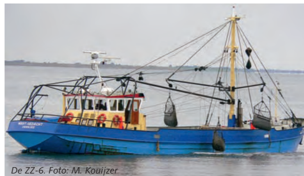
De ZZ-6.

Het duiken bij de eerste twee noordelijke pijlers van de Zeelandbrug (aan de kant van Zierikzee) is toegestaan maar vraagt om extra aandacht van de sportduiker. Deze duiklocatie ligt namelijk op een schelpdierperceel welke wordt gepacht door de eigenaars van de kotter ZZ-6. Zij komen hier regelmatig (veelal met hun kotter ZZ-6 en incidenteel met een andere kotter) en vissen dan tot dicht langs de pijlers en de wal. Kijk dus goed vóórdat het water wordt ingegaan of men bezig is met vissen en raadpleeg de eventuele bekendmakingen van de vissers op het informatiebord ter plaatse. Wordt er gevestigd? Ga dan naar een andere duiklocatie! Deze spelregel geldt overigens ook voor andere duiklocaties zoals bij de Val, Noordbout, Plompe Toren en Gorishoek. Ook dit zijn duiklocaties op of nabij schelpdierpercelen.